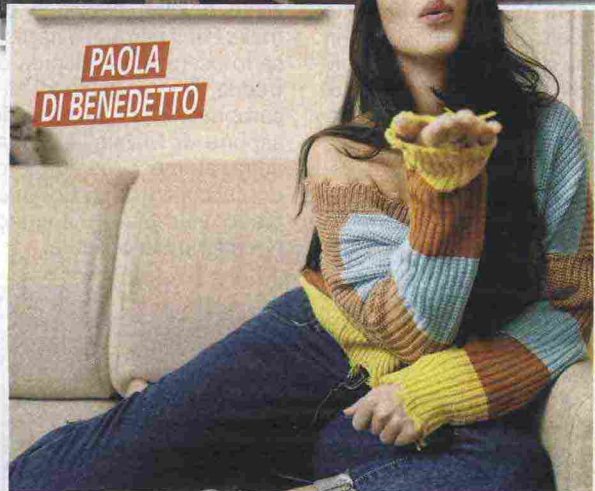
PAOLA DI BENEDETTO